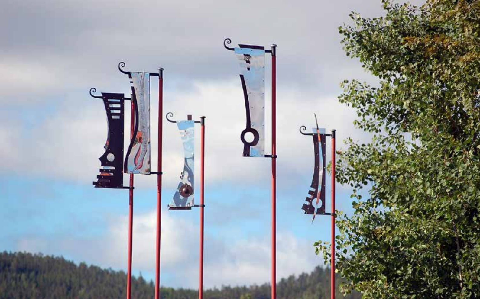
Konstverk av Fredrik Thelin.

Agenda 2030 utgår från att vår tids stora utmaningar är sammanlänkade och måste lösas genom ett samarbete och partnerskap, då målen är odelbara och integrerade. Det krävs samverkan för att målen ska kunna uppnås och kulturen kan ha en sammanlänkande kraft och tillåta människor att mötas oavsett kön, etnisk tillhörighet eller ålder. Arbetssättet med både den regionala och lokala kulturplanen går i linje med mål 17 om vikten av samarbete över gränser för att skapa en hållbar utveckling. Samverkan främjar ett innovativt klimat- och miljöarbete som i sin tur kan bidra till att driva en hållbar utveckling. Den lokala Kulturplanen tar avstamp i ”Regional kulturplan Gävleborg 2019–2021”, vilken verkar både direkt och indirekt för att nå de globala målen framför allt genom utvecklingsområdena ”Öppenhet och demokrati” samt ”Hållbar attraktivitet”.