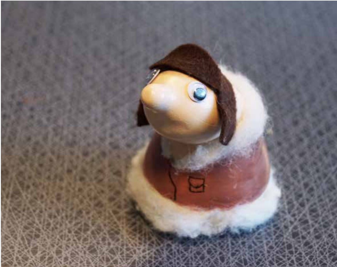
Figuren är en "Gurgla" och skapas i bildundervisningen av 9:orna på Bergsjö skola.