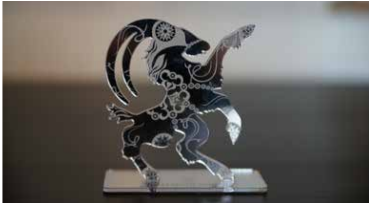
Hälsingebocken gestaltad av Caroline Tinterova.