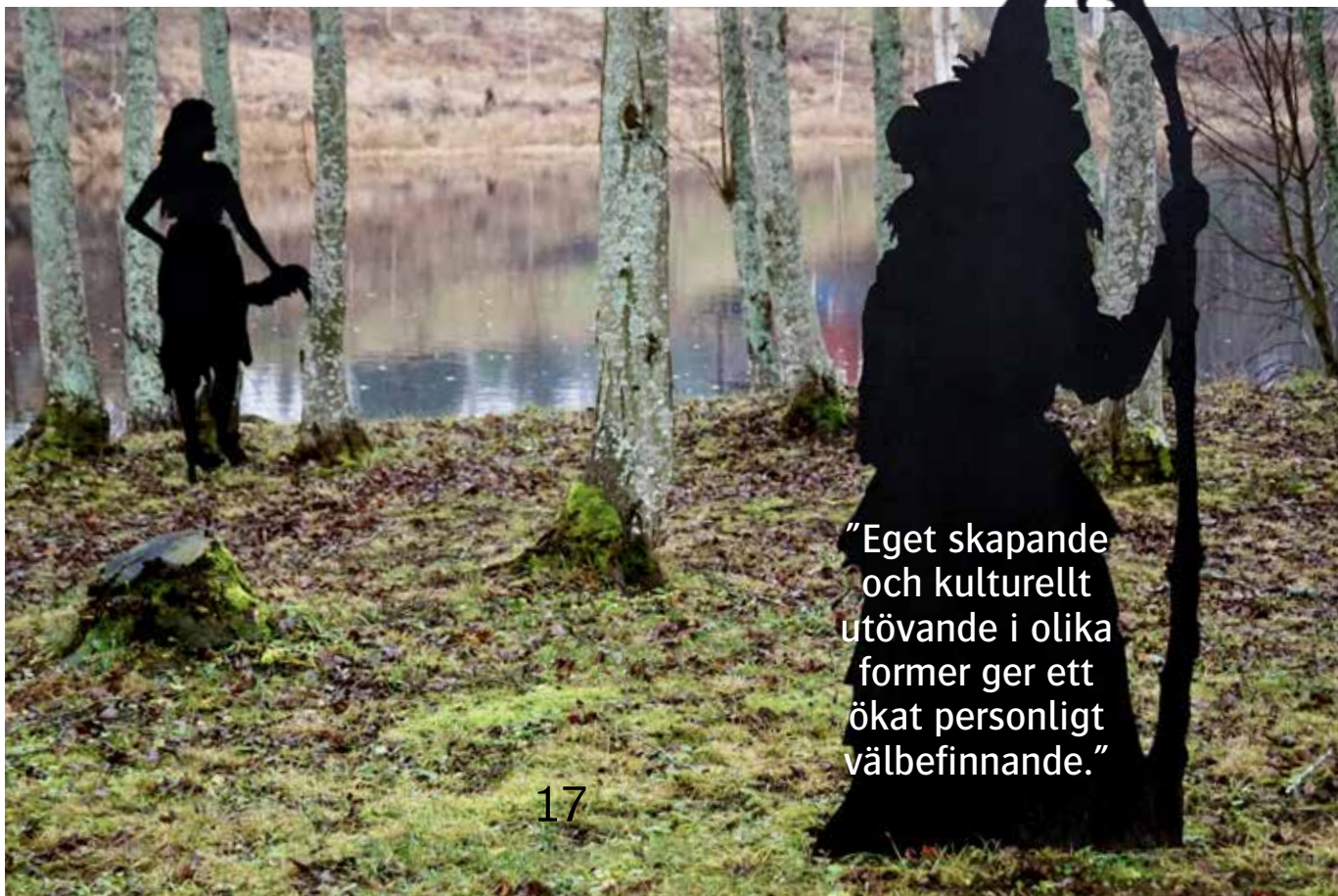
Konstverk av Anja Tellin.

”Eget skapande och kulturellt utövande i olika former ger ett ökat personligt välbefinnande.”