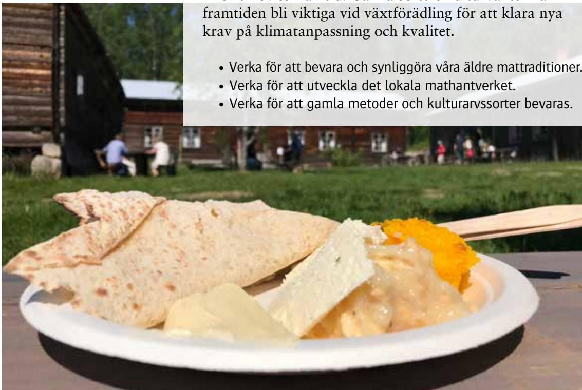
Ersk-Matsgården i Hassela.