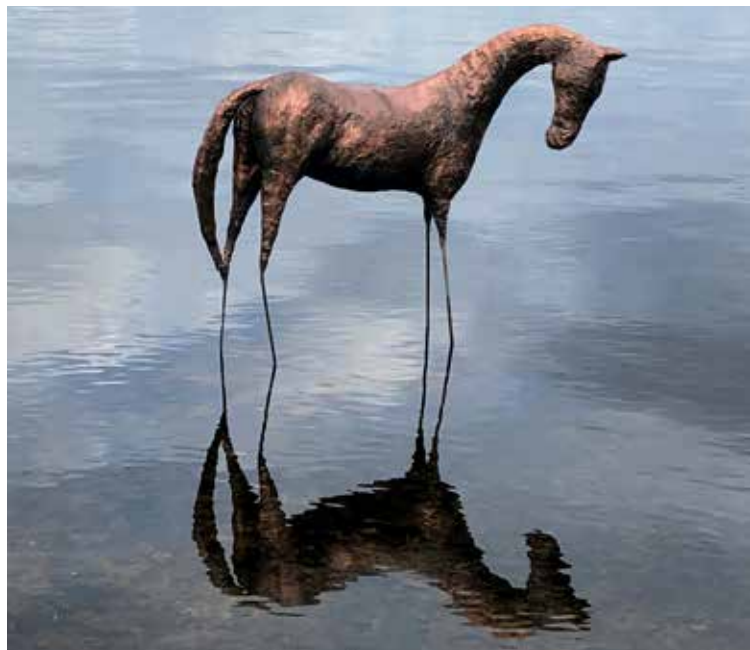
Skulptur av Helena Henning Bernmyr.

Att ta hänsyn till barns intressen, att låta barnets intresse väga tungt gentemot andra intressenters samt att låta barnen komma till tals är bra utgångspunkter om man vill säkerställa att man följer barnrättslagen.